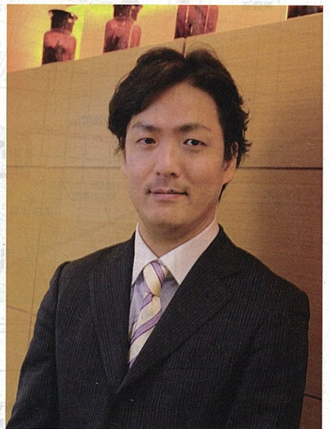
▲多忙な毎日ながら、休日には名古屋バルコにある「センチュリーシネマ」で映画を観てリフレッシュすることもあるそう。

をしたという方は年々増えていきます。そんな患者さんやご家族のお役に立ちたいと考えて、処方せんに従った痛みを和らげる薬などを当社の薬剤師がご自宅までお届けするシステムを構築しました。終末期医療に携わることが確かに責任の重い仕事ですが、だからこそ医療人としての原点を日々